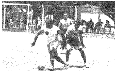
Novos jogos movimentam a Copa Papai Bom de Bola

Membras de Ouro SRT x Cruzeiro São Luís, que chegam a esta rodada após vencerem seus compromissos na semana passada no shoot-out. No sábado a tarde, mais duas partidas irão movimentar a competição. As 14h45, tem Juventude Maranhense x Olímpica (+30) e, às 16h, tem AABF x Cruzeiro (+40). No domingo será completada a rodada com a realização de mais cinco partidas. Pela manhã, a partir das 8h, tem Alast e X Aurora (+30) e Grêmio Maranhense x Society Club Calhau (+30). A tarde, as disputas continuam a partir das 14h45: Ponte Preta x Flamengo (+30), Olímpica x Grêmio Maranhense (+40) e Palmeirinha x Membras de Ouro (+40).